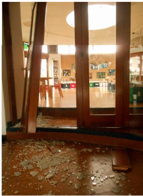
La porte de la salle des tout-petits de la Petite Bibliothèque Ronde Clamart fracturée et la salle vandalisée.

Service public ouvert à la population dans son ensemble, les bibliothèques et médiathèques accueillent une variété de personnes et contribuent ainsi à faire vivre la collectivité. Ce travail quotidien porte ses fruits et apporte à beaucoup de concitoyens des satisfactions réelles qui ne sont pas toujours formulées. Mais parfois, cette ouverture sur le monde (qui gagnerait à s'étendre par l'élargissement des horaires) se traduit par des situations conflictuelles voire violentes.